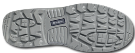
Imagem do relevo da sola