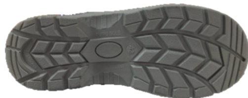
Imagem do relevo da sola