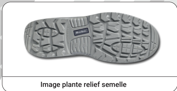
Image plante relief semelle

Fabricant: Marca Protección Laboral S.L.