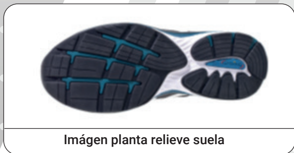
Imágen planta relieve suela

Fabricante: Marca Protección Laboral S.L.