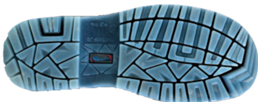
Imágen planta relieve suela