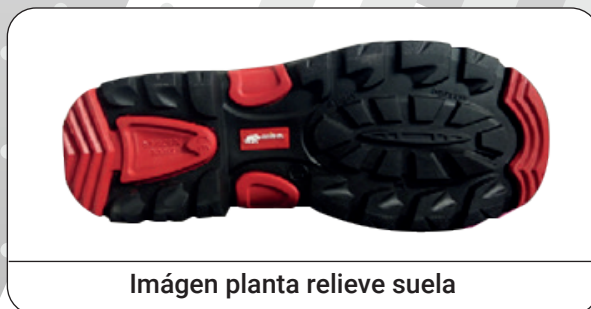
Imágen planta relieve suela

Fabricante: Marca Protección Laboral S.L.