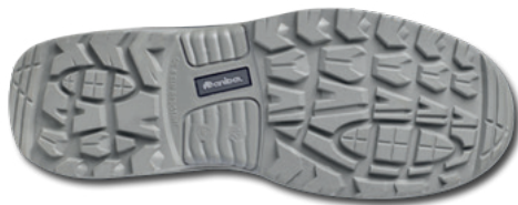
Imágen planta relieve suela

Fabricante: Marca Protección Laboral S.L.