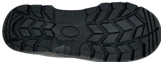
Imagen planta relieve suela