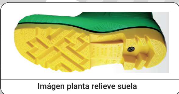
Imágen planta relieve suela

Distribuidor: Marca Protección Laboral S.L.